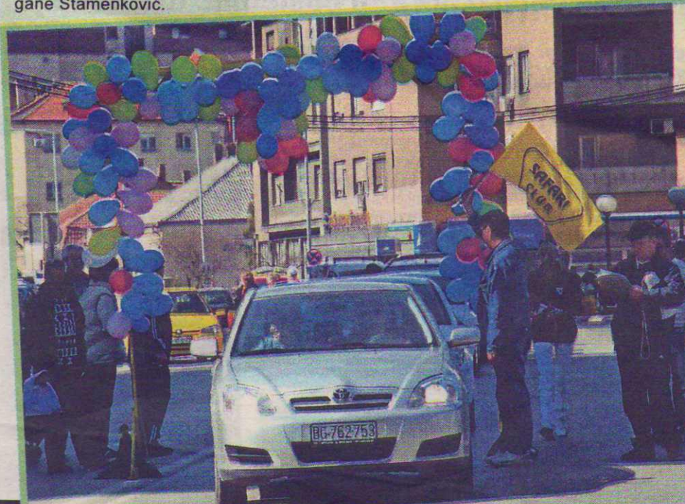
Gužva na startu