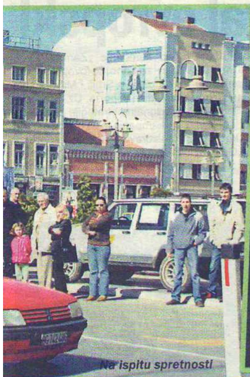
Na ispitu spretnosti